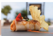
PAPAS CON MOJO